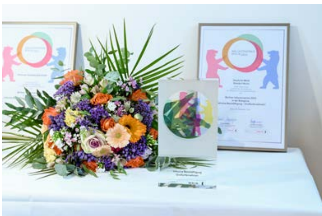
Das Siegerpaket für alle Gewinnerinnen und Gewinner.