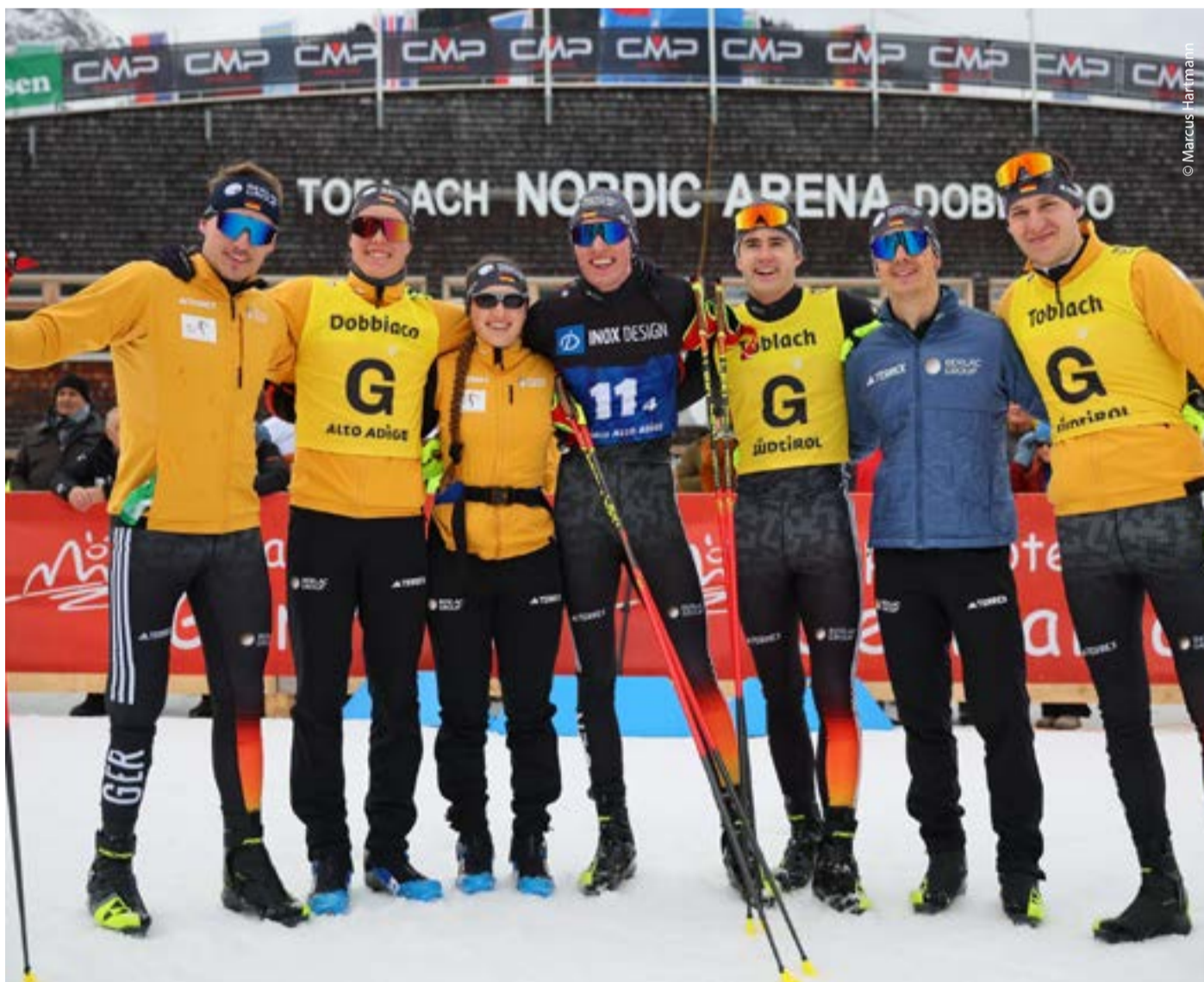
Die offene Staffel kann ihren Triumph aus Östersund 2023 nicht wiederholen und freut sich trotzdem.