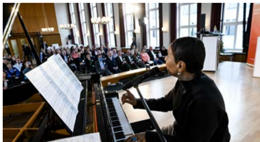
Bei der Veranstaltung gab es auch einen musikalischen Teil.

„Die Auszeichnung der Firma Repro- & Werbezentrums Prenzlauer Berg GmbH belegt