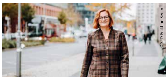
Berlins derzeitige Pflegesenatorin Dr. Ina Czyborra.

Dazu Berlins Pflegesenatorin Dr. Ina Czyborra: „Die vom Land Berlin anerkannten Angebote zur Unterstützung im Alltag sind aus der Berliner Pflegelandschaft nicht mehr wegzudenken. Sie zeigen sich als tragende Säule zur Unterstützung und Entlastung pflegebedürftiger Menschen im eigenen Zuhause. Mit diesen Leistungen und durch die Unterstützung engagierter Ehrenamtlicher werden mehr