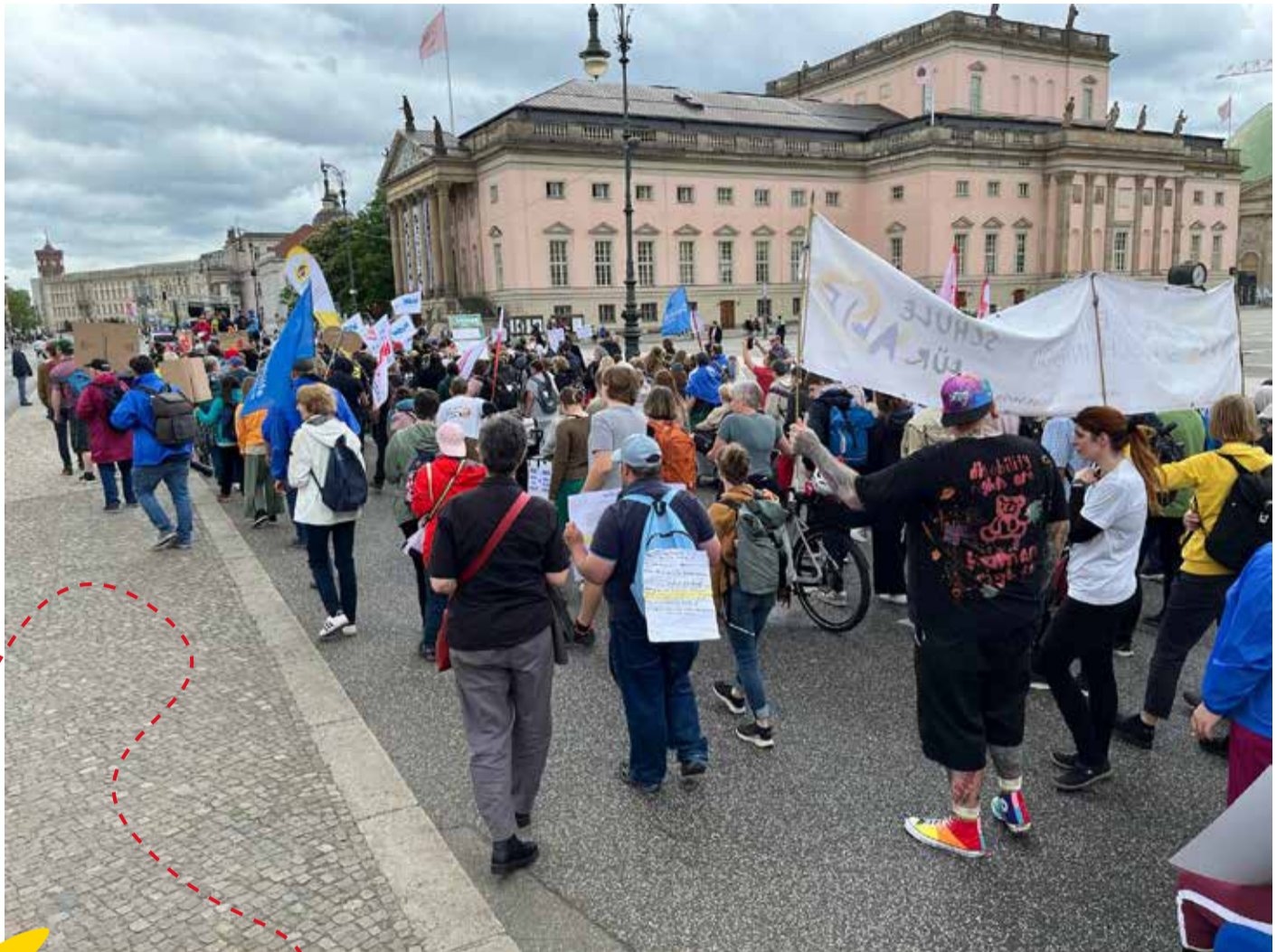
Auf dem Protesttag 2024 war viel los - dieses Jahr hoffentlich auch.

A.) Baubeginn 2026! Die Planungen sind abgeschlossen, die Beteiligung war umfassend, und das Preisgericht hat einstimmig entschieden – wir brauchen keine weiteren Verzögerungen, sondern Taten!