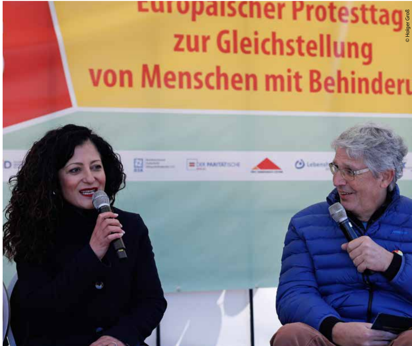
Zur Abschlusskundgebung war die Sozialsenatorin Cansel Kiziltepe (links) gekommen.

Die Forderung ist nur „Gleicher Lohn für gleiche Arbeit“ – überhaupt nicht mehr. Der Senat muss den Tarifvertrag endlich anerkennen, sonst werden Menschen, wie ich, systematisch ausgeschlossen. Inklusion darf kein Lippenbekenntnis bleiben – sie muss gelebt werden.