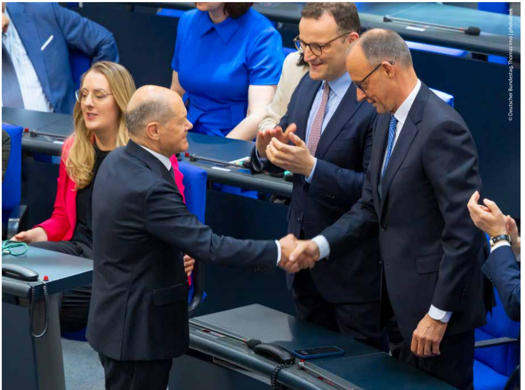
Olaf Scholz (SPD) gratuliert Friedrich Merz (CDU) zu seiner Wahl zum Bundeskanzler. Ob damit Themen rund um Behinderung besser behandelt werden, ist sehr fraglich.