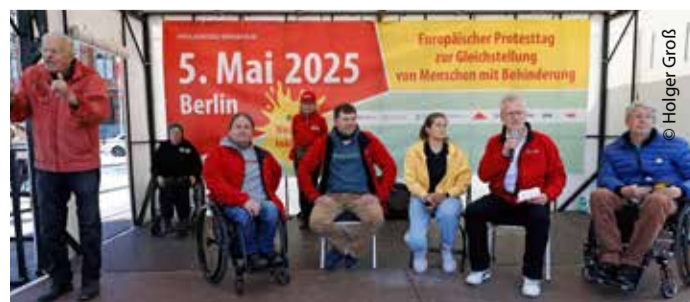
Bei der Abschlusskundgebung kam auch die Inklusion und barrierefreie Sportstätten zur Sprache.