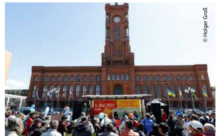
Die Abschlusskundgebung fand vor dem Roten Rathaus statt.