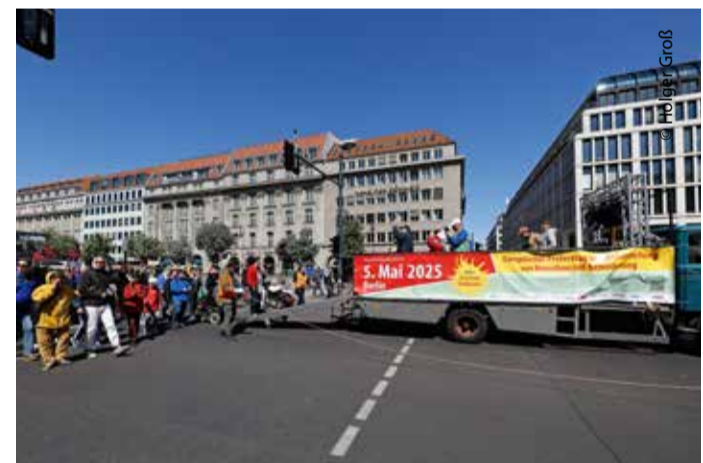
Der Demozug lief entlang der Straße Unter den Linden.