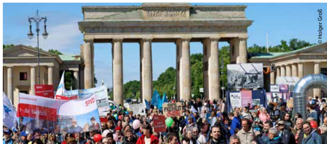
Rund 2.000 Teilnehmende trafen sich am Startpunkt vor dem Brandenburger Tor.

Dem Aufruf sind dieses Jahr rund 2.000 Teilnehmende gefolgt. Ein Rückblick in Bildern.