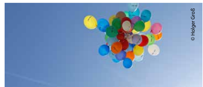
50 bunte Ballons stiegen für die Anna-Seghers-Schule in den blauen Himmel.