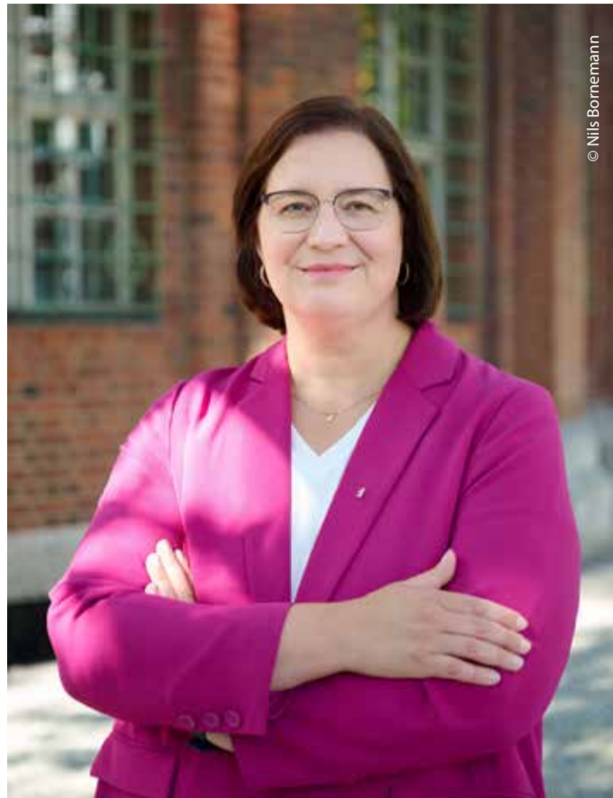
Staatssekretärin für Gesundheit und Pflege, Ellen Haußdörfer.

Die Senatsverwaltung für Wissenschaft, Gesundheit und Pflege fördert die Beratung durch die beiden Selbsthilfe-Dachverbände. Die Landesvereinigung Selbsthilfe Berlin ist der Dachverband der Selbsthilfeorganisationen in Berlin. SELKO ist der Dachverband der Selbsthilfe-Kontaktstellen und der Kontaktstellen PflegeEngagement in Berlin. Die dritte Beratungsstelle ist bei der Kiezspinne FAS e.V.