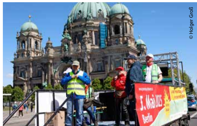
Der Musikwagen sorgte für gute Stimmung - genau wie das Wetter.