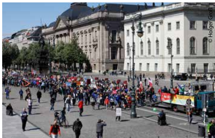
Es ging am Bebelplatz und der Museumsinsel vorbei.