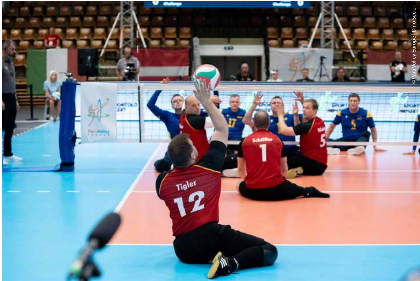
Die deutschen Sitzvolleyballer im Halbfinale gegen die Ukraine.