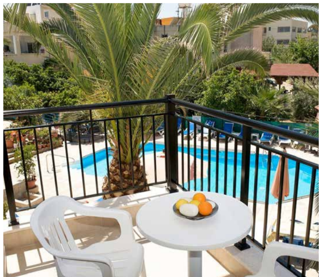
In den „C &amp; A Apartments“ auf Zypern gibt es Zimmer mit einem Balkon.