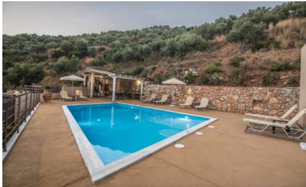
Der barrierefreie Pool im „Hotel Aksos Suites“.

Aksos-Suites, die alles daran setzen, dass auch Menschen mit Behinderung einen unvergesslichen, erholsamen Urlaub erleben.