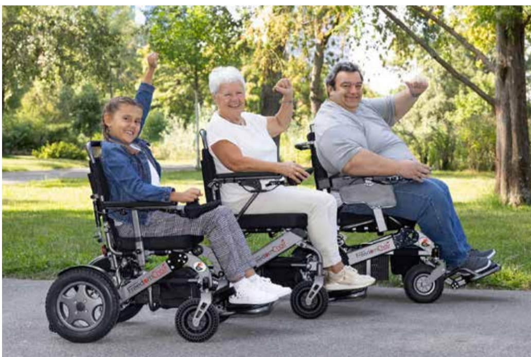
Der FreedomChair A12S gibt es auch für Kinder.

Die gesamte FreedomChair-Serie verabschiedet sich vom klassischen Silber und erscheint künftig in stilvollem Anthrazit-Metallic. Der neue Look unterstreicht die moderne Ausrichtung der gesamten Serie – hochwertig, urban und selbstbewusst.