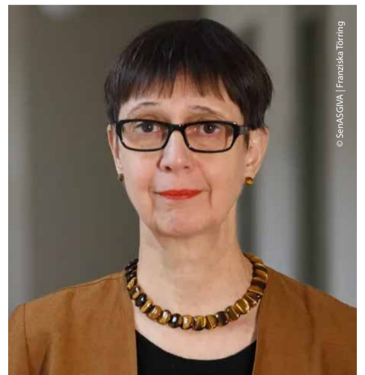
Berlins amtierende Landesbeauftragte für Menschen mit Behinderung, Christine Braunert-Rümenapf.

Ein zentrales Thema ist ihre Ombudsfunktion: 2023 bearbeitete sie 447, im Jahr 2024 401 schriftliche Anfragen von Bürgerinnen und Bürgern zu möglichen Rechtsverletzungen. Zusätzlich gab es täglich drei bis zehn telefonische Beratungen. Häufig ging es um Barrieren bei Mobilität, Probleme mit Behörden (zum Beispiel bei Leistungen oder der Anerkennung einer Schwerbehinderung) und die Suche nach barrierefreiem bezahlbarem Wohnraum.