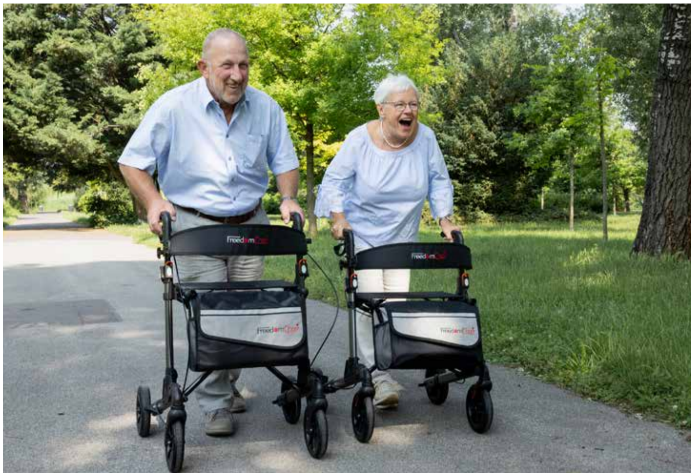
Der leichte Rollator R03 sorgt für eine gute Mobilität.

Ganz neu im Sortiment ist der moderne Rollator R03, der ebenfalls durch sein geringes Gewicht von 7,8 Kilogramm, einfaches Handling und praktische Details wie einen integrierten Sitz und Stauraum überzeugt. Besonders praktisch ist, dass der R03 zweifach faltbar ist und sehr kompakte Abmessungen für die Ver-